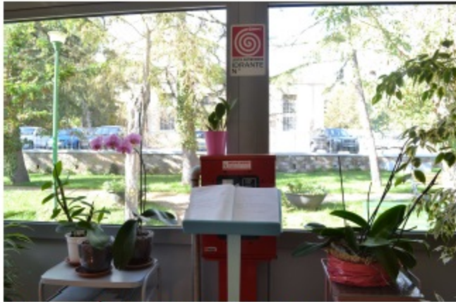
Chi vuole può lasciare un proprio pensiero...