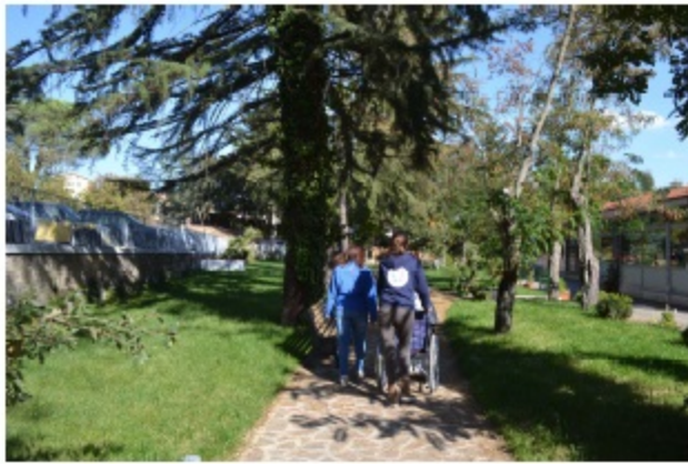
Nel parco, con le Volontarie del Servizio Civile