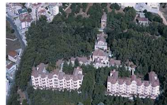
Ospedale “Cesare Zonchello” Nuoro oggi

Cala Gonone 22 e 23 Maggio 2015 Hotel Nuraghe Arvu Viale del Bue Marino