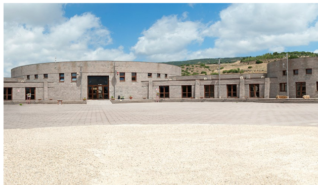
Centro Giovanni Lilliu - Barumini