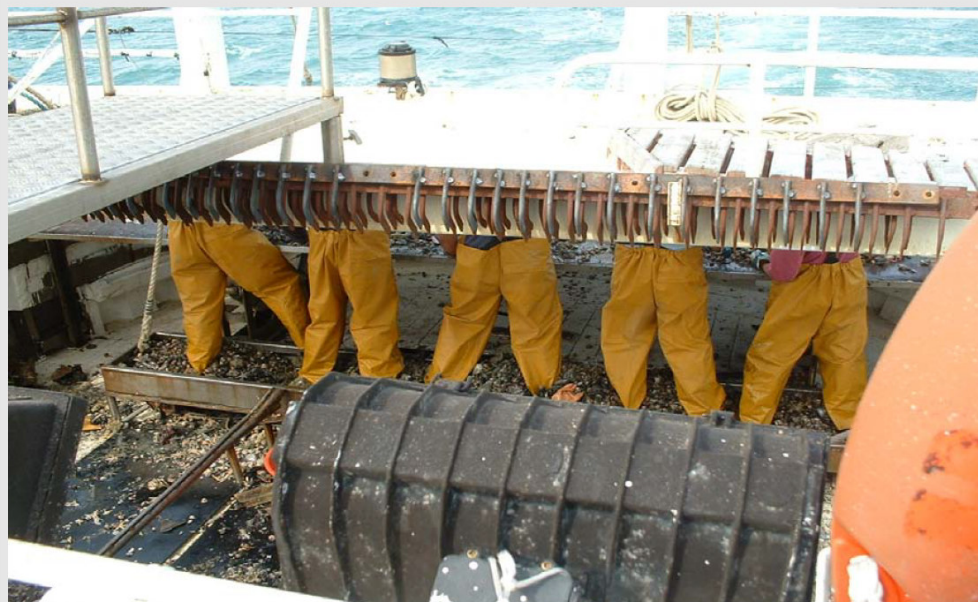
Cernita a poppa con operatori in piedi

RISULTATI RAGGIUNTI E ATTESI la realizzazione del piano di poppa regolabile in altezza tramite meccanismo pneumatico ha comportato una netta riduzione del rischio derivante dalle posture incongrue e dal sovraccarico del rachide consentendo ai marinai di compiere una lunga cernita a schiena eretta. Sono state evidenziate anche alcune modifiche relative all'organizzazione del lavoro come la riduzione dei tempi di cernita a poppa e la conseguente possibilità di godere di tempi di recupero.