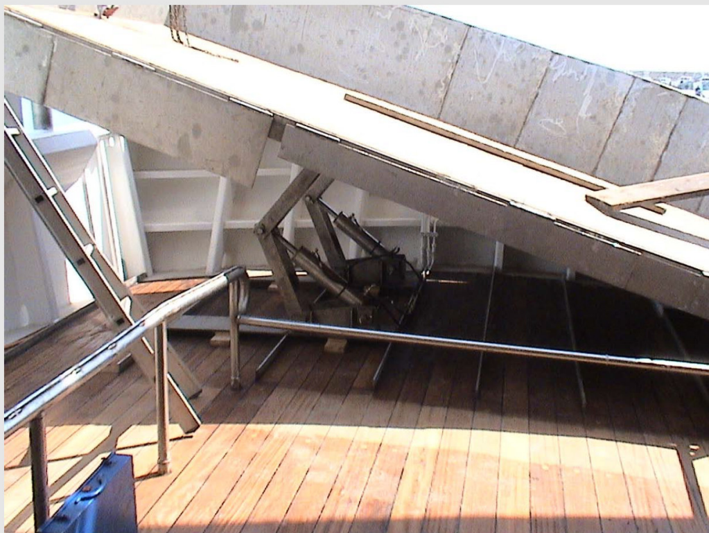
Particolare del piano di poppa rialzabile con meccanismo pneumatico

□ OVE POSSIBILE, ALLEGARE FOTO e/o ILLUSTRAZIONI DELL'ESEMPIO DI BUONA PRASSI , per esempio fotografie di un ambiente di lavoro riprogettato, materiale illustrativo relativo alle azioni intraprese o materiale di formazione.