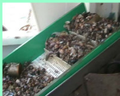
Nastro di carico e lavaggio