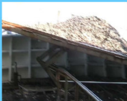
Piano di poppa rialzabile ed inclinabile

La linea è costituita da un sistema di nastri (tapis roulant) che dal pianale di poppa, rialzato ed inclinabile, trasportano il pescato su un nastro di carico, su un nastro di lavaggio (inclinato) e poi su un nastro di cernita che decorre in piano e permette una permeabilità ai flussi di lavaggio creati per il percolamento dei residui. Possiede anche dei deflettori per l'eliminazione automatica dei residui. L'ultima parte della linea è costituita dal selettore dei prodotti residui. Tutta la linea è fissata in modo permanente al ponte di coperta ed è dotata di pulsante di stop e di regolatore di velocità.