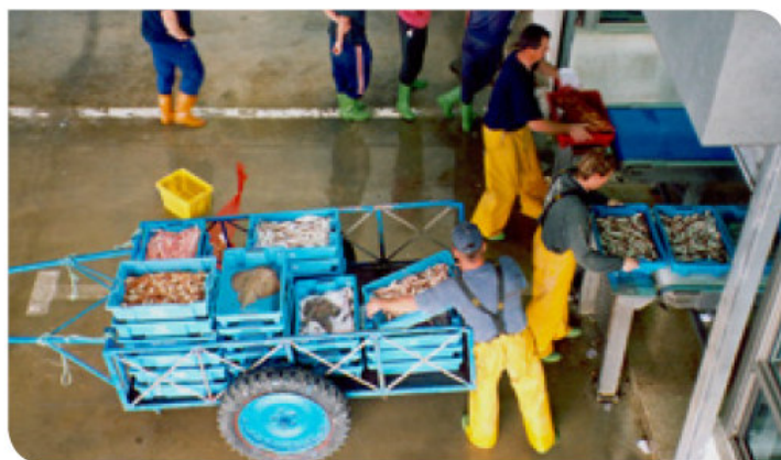
II-6. Buona attrezzatura per il trasporto manuale.