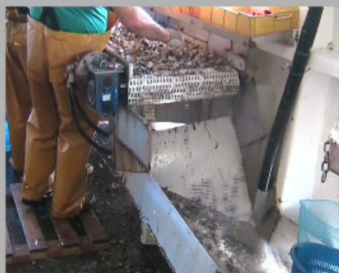
Eliminatore di residui